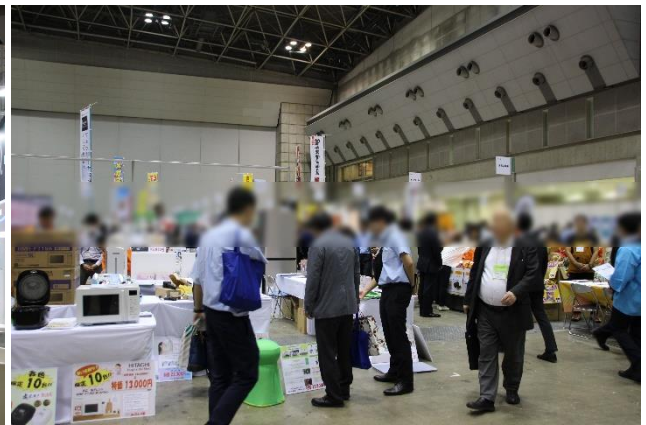
<家電・工具他各地の物産等を購入できるコーナー>