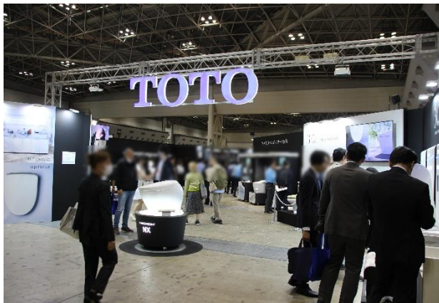
<代表的な展示ブース>